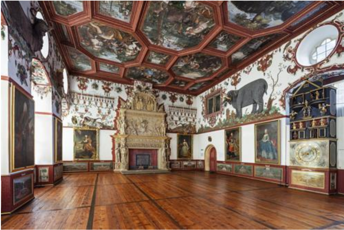
Abbildung 7: Knight's Hall + Room 72 - to the east