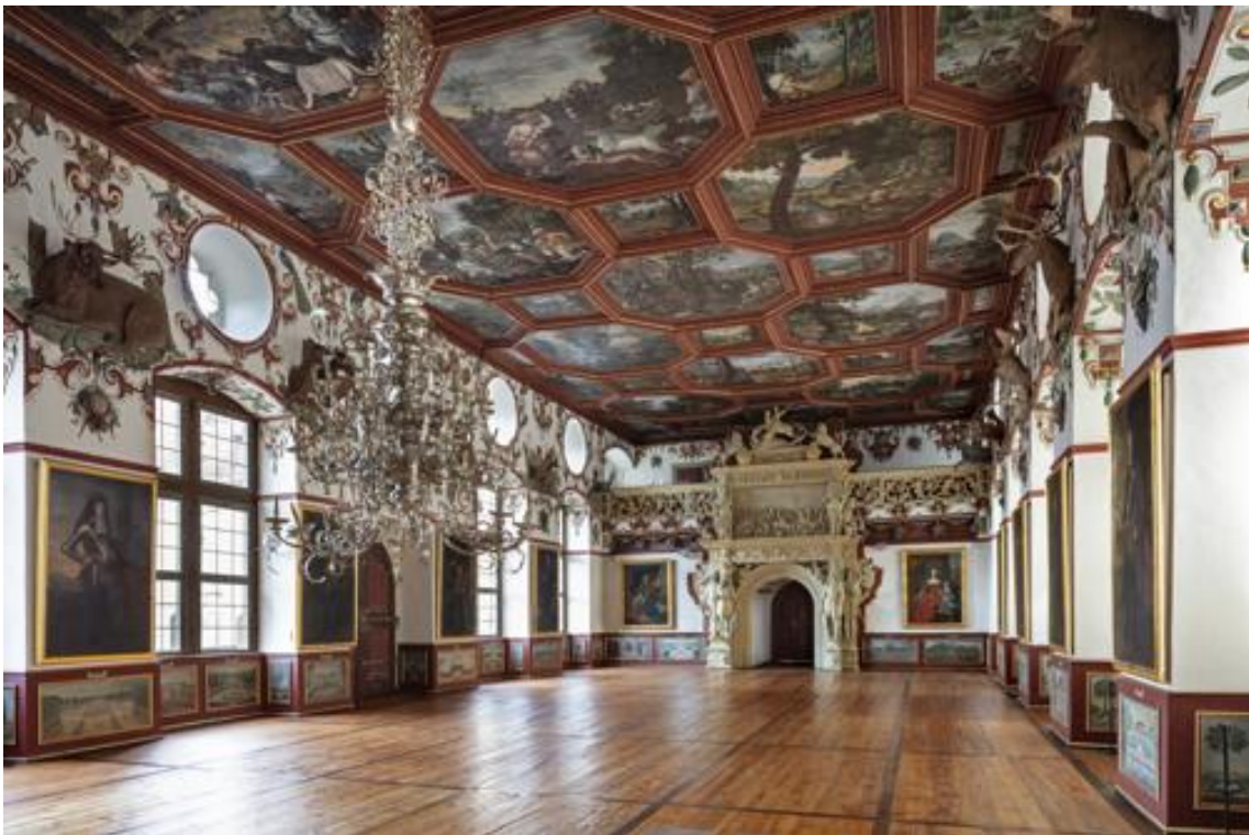
Abbildung 1: Knight's Hall + Room 72 - to the west