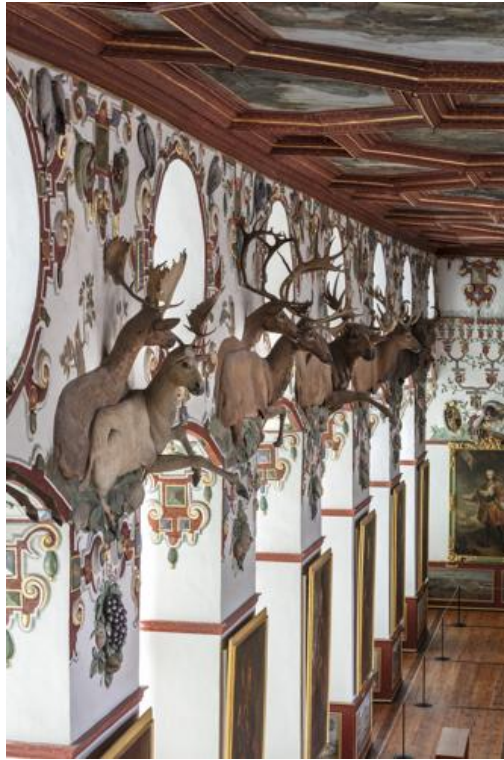
Abbildung 5: Deer pairs – general view