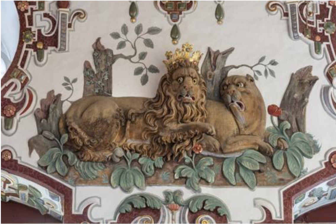
Abbildung 2: Lion couple – general view