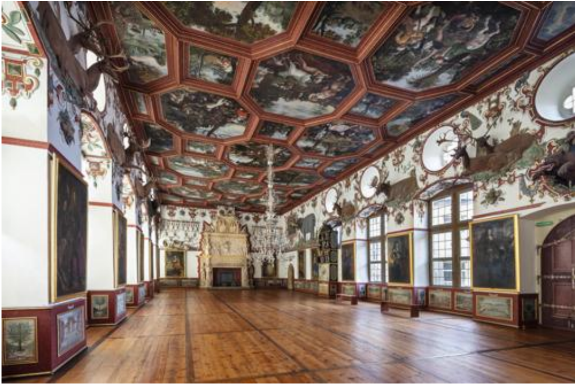
Abbildung 6: Knight's Hall + Room 72 - to the east