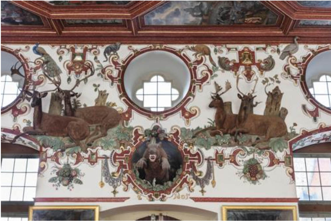
Abbildung 3: Bear – general view