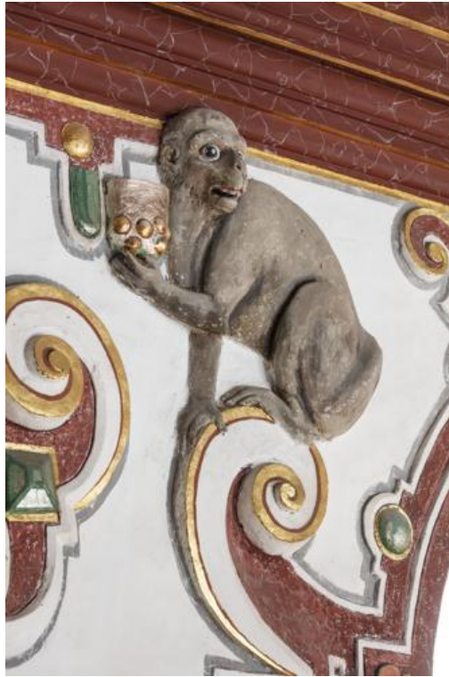
Abbildung 4: Monkey - general view